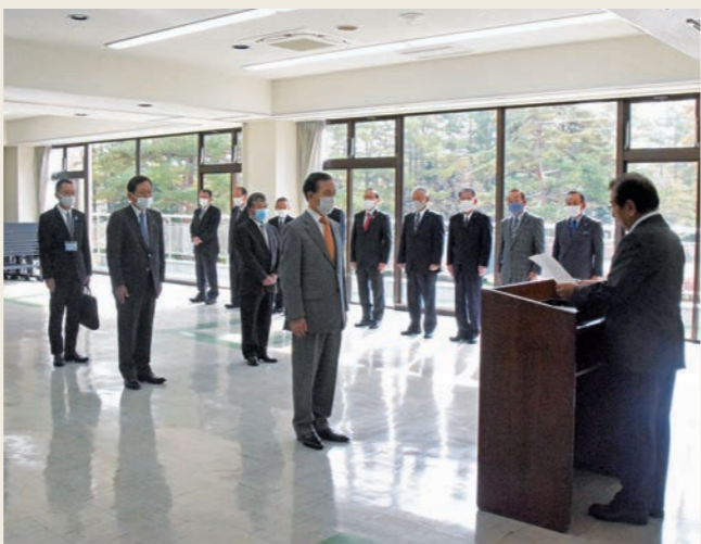
市村配分金交付式 令和2年10月28日