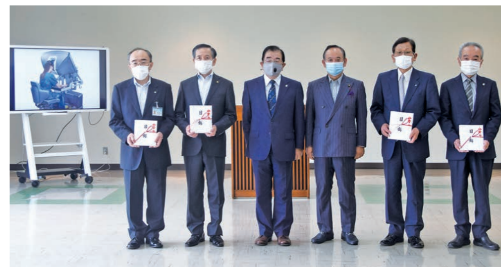
寄贈式 令和2年7月9日

非常に高度な内視鏡手術を行うための医療機器であり、低侵襲で安全・安心な手術を行う事ができる手術支援ロボット「ダヴィンチ」を国民健康保険富士吉田市立病院へ寄贈しました。